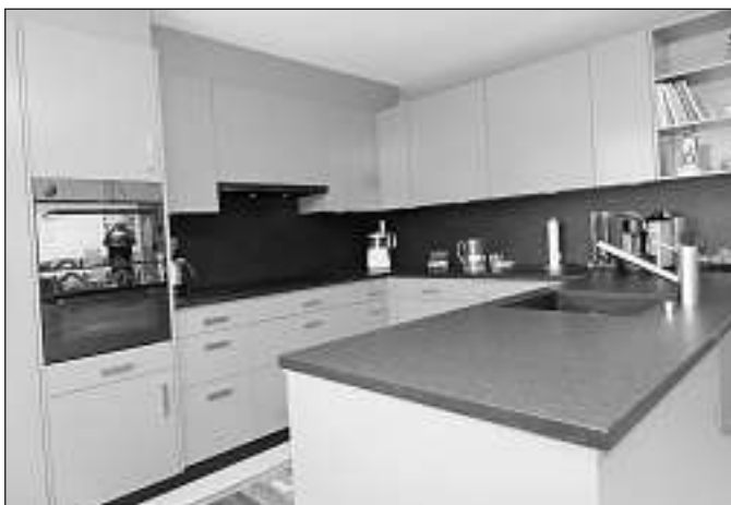
Küche im klassischen Stil mit modernsten Einbaugeräten.

Das grösste Plus von «Sälde 2» ist in der individuellen Ausgestaltung der Wohnflächen zu sehen. Die Stockwerkeigentümer konnten ihr Geschoss im Rohbau übernehmen und individuelle Wünsche bezogen auf Raumteilung und Materialisierung einbringen.