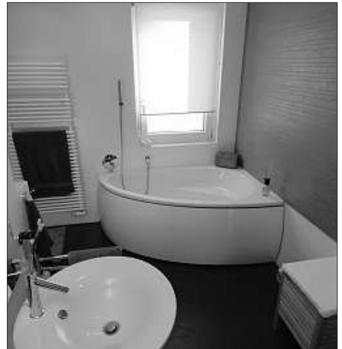
Raumangebot optimal genutzt: ein Traum von Bad.