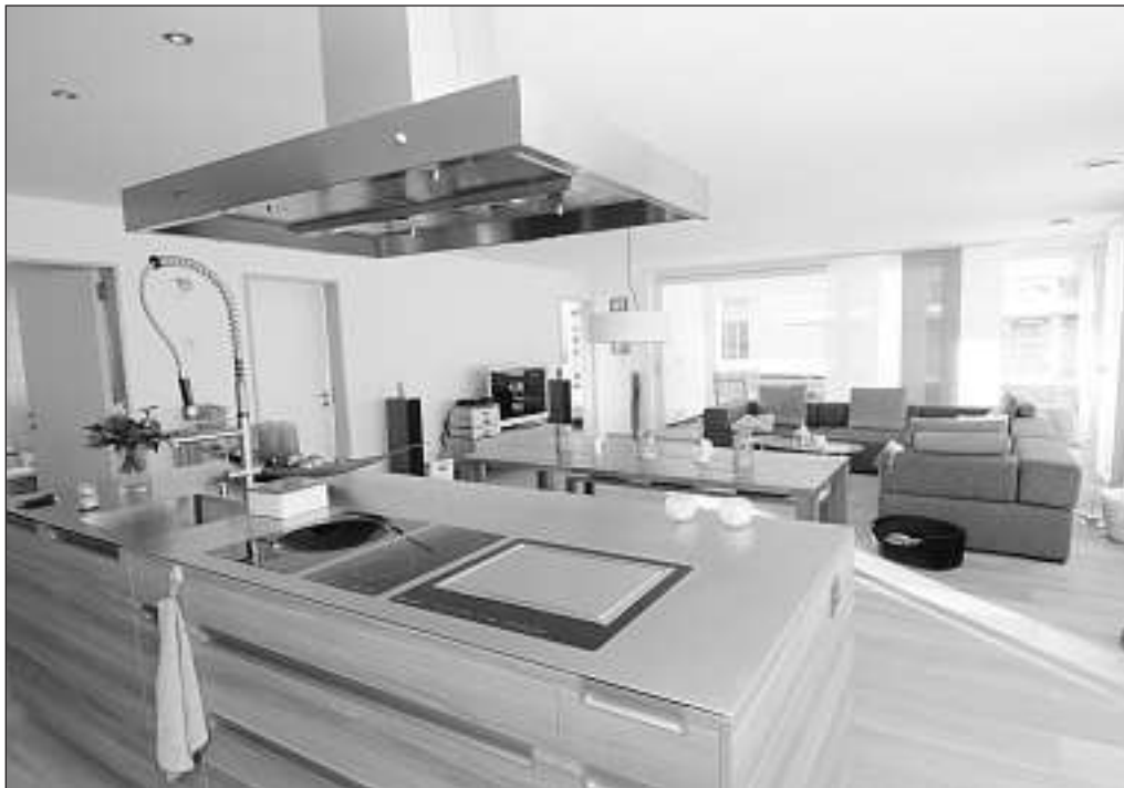
Grösstmögliche Individualität zeigt sich im Bereich der Kochinsel. Hier steht unverkennbar ein Profi am Herd.

Das Gebäude wurde in Massivbauweise erstellt. Die Aussenhülle ist sehr gut gedämmt und mit einer hinterlüfteten, offenen Lärchenschalung verkleidet. Das Minergetelabel ist beantragt. Bei der Materialwahl wurden ökologische Aspekte berücksichtigt. Auch dem Schallschutz wurde hohe Beachtung geschenkt. Der Lift erschliesst alle Geschosse behindertengerecht.