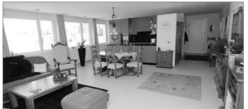
Wohnen mit Stil (-möbeln) ist auch in hochmodernen Grundrissen durchaus angezeigt.