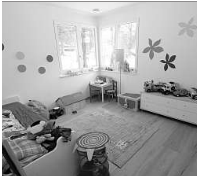
Viel Licht im Kinderzimmer dank Doppelfenster gegen Nordosten.

Es bleibt, allen Beteiligten einen Dank für ihre wertvolle Mitarbeit auszusprechen. Es sind dies einerseits die Ingenieure für ihre Fachplanung, andererseits die Unternehmer, die mit grossem Einsatz qualitativ hochstehende Ar-