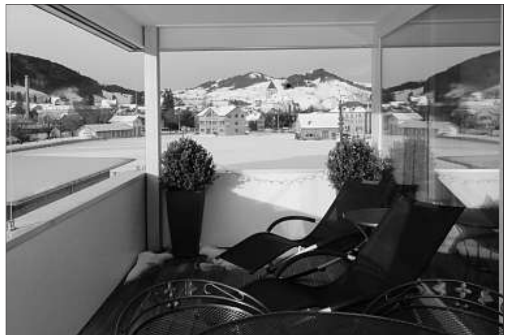
Herrlicher Ausblick nach Südwesten vom gedeckten Balkon wie auch vom Wohn-/Essbereich aus.