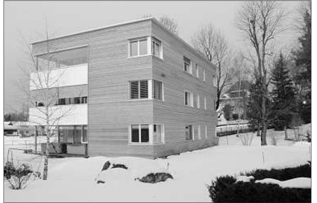
Glückliche Beziehung zu den Nachbarliegenschaften – rechts der alte Baumbestand der Villa Sälde.