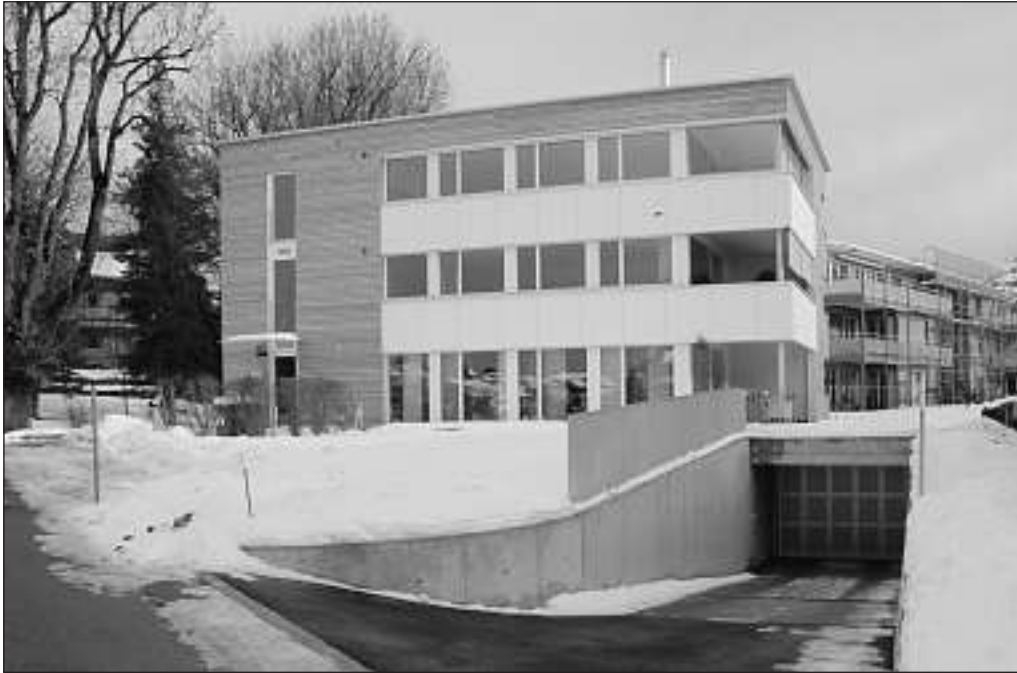
Blick auf die Hauptfassade des Hauses «Sälde 2» mit Einfahrt zur Tiefgarage.